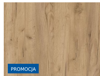
Blat kuchenny Dąb Craft Złoty K003 FP