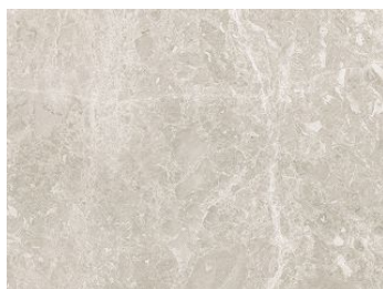
Płyta Splashback Navona Kremowa K367 PH