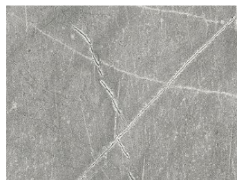
Blat Slim Line Marmur Atlantycki Szary K368 PH